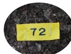
(樹木調査のナンバリング)

第72号 平成31年4月25日 発行 愛国学園大学附属龍ヶ崎高等学校 住所 〒301-0041 茨城県龍ヶ崎市若柴町2747 URL http://www.aikoku-ryugasaki.ed.jp