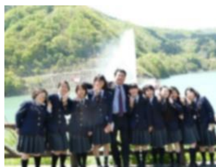
寒河江ダムの前で校長先生を囲んで