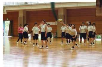
二冠をとった蘭組↑