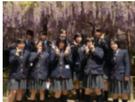
北方文化博物館の藤棚とともに