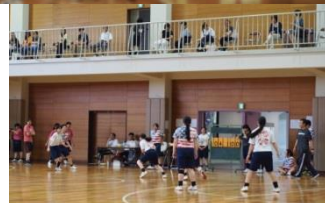
保護者の方々に2階から見守っていただきました