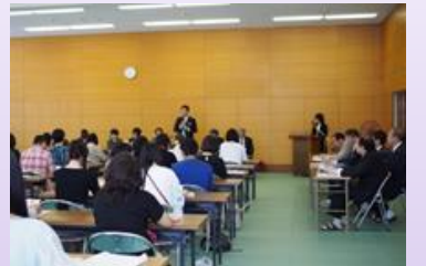
↑母師会総会 ↓公開授業

これからも、学校の取り組みや生徒たちの活動が生徒たちの成長に寄与し、保護者の皆様に伝わるよう教職員一同努めていきますので、保護者の皆様の積極的参加をよろしくお願いいたします。