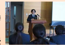
↑代表生徒による選挙演説

5月14日(月)、龍ヶ崎市選挙管理委員会の方々に来ていただき、3年生を対象に主権者教育出前授業を行いました。選挙についてのお話を聞いた後、代表者4名が立候補者となり、模擬選挙も行いました。数年後には18歳から成人となります。「成人」としての自覚を持って政治にも更に興味・関心を持っていきたいですね。