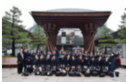
金沢駅での集合写真(1日目)

3月20日(火)~25日(日)の5泊6日で、新3年生は関西北陸修学旅行に行ってきました。3月下旬とは思えないほど寒く、風に吹かれながらの金沢の兼六園見学から修学旅行をスタートしました。2、3日目は雨も降り、不安なスタートでしたが、4日目からは天気が味方をして、晴天の下でユニバーサル・スタジオ・ジャパンを楽しむことが出来ました。最終日には「奥の細道結びの地記念館」を訪れ、東北旅行から続く芭蕉の足跡を辿る旅は終わりましたが、皆さんの高校生活は残り1年続きます。芭蕉のように、一步一步自分の足でゴールを目指していきましょう。