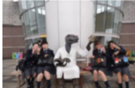
恐竜博物館の前で(2日目)