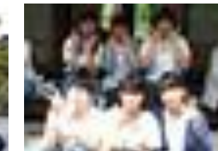
↑高原寮にて四街道の生徒と共に