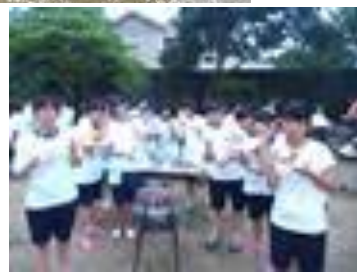
↑バーベキューでいただきます!!