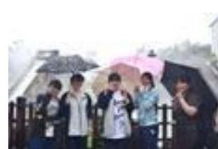
↑雨に降られた 草津観光