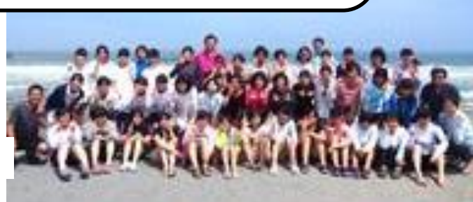
校長先生を囲んで→