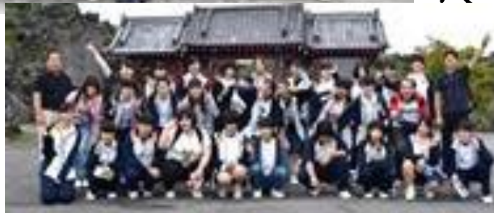
←鬼押し出し園にて