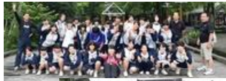
↑ タリアセンにて ピース!!

四街道校の生徒と合同での宿泊生活ということで、行く前は戸惑いの声も聞こえていましたが、行ってみると多くの生徒が四街道校の生徒達と交流を持ち、最終日には別れを惜む姿も見られました。高校生活も残り半分です。この経験をこれからの学校生活に活かしていきましょう。