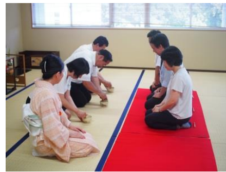
先生方の礼法研修を実施しました!