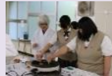
↑ 短大の授業 (食品の変化～おいしさの発現～)