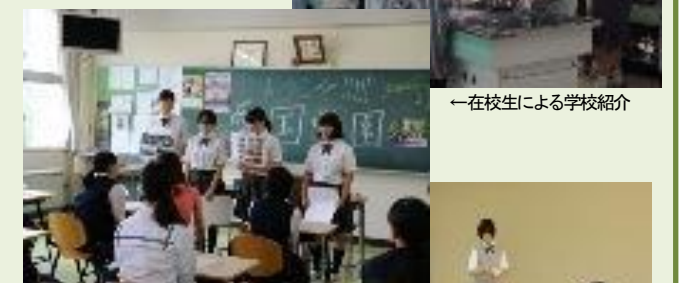
←在校生による学校紹介