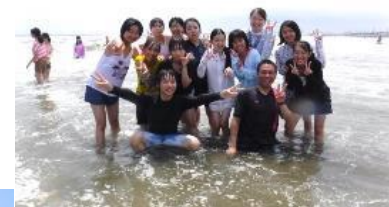
←波遊びをしながら ハイチーズ