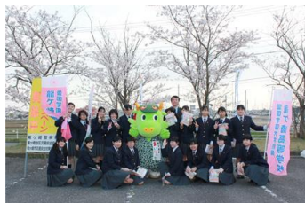
春の交通安全運動 高校生街頭キャンペーン

入学おめでとうございます。新入生の皆さんが1日も早く学校生活に慣れ、楽しく充実した日々を過ごせるよう、学年スタッフ5人でサポートしていきます。良好な人間関係を築くにはコミュニケーションが大切です。毎日休まず登校し、笑顔で1日を過ごしましょう。